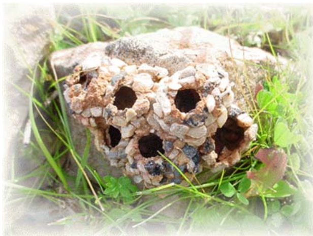
Figura 2. La forma de comunidad territorialmente definida hoy juega un papel menor en la reestructuración de las relaciones sociales. (Alrededores de Badajoz, 25/12/03.) En: Sociedad y territorio ( http://www.unex.es/eweb/sociolog/giesyt_menu2.htm ) [Consultado: 11, 3, 2005]

son las entidades con mayor aptitud para la diferenciación. [...] Son las culturas locales las que están marcadas por una fuerte impronta homogenizadora, al seguir utilizando el criterio de atribución de identidades basado en el lugar de nacimiento o en el lugar de residencia.”(Echeverría, pp.148 -149). Observamos entonces que la comunidad territorialmente definida jugaría hoy un papel menor en la reestructuración de las relaciones sociales (Castells, 1983), ya que la gente no construiría su significado en las sociedades locales, exclusivamente, dado que seleccionaría sus relaciones en base a sus afinidades. (Fig.2)